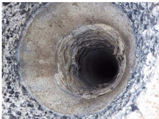
劣化した煙突断熱材(ニューカポスタック)