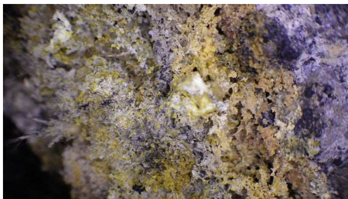
煙突断熱材の落下物 アモサイト

(一社)日本アスベスト調査診断協会は事前調査から除去工事までのアスベスト対策について総合的に対応しております。アスベストに関してご質問及び協会にご興味のある方はぜひご連絡下さい。