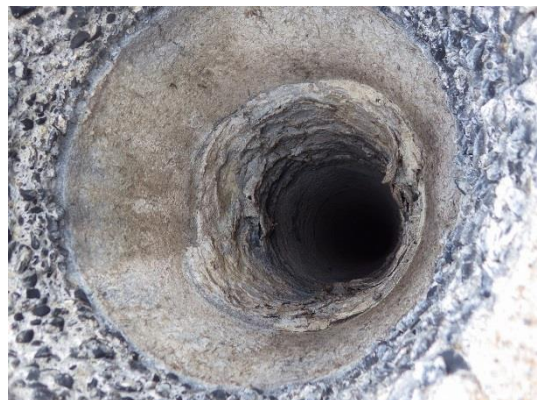
劣化した煙突断熱材(ニューカポスタック)